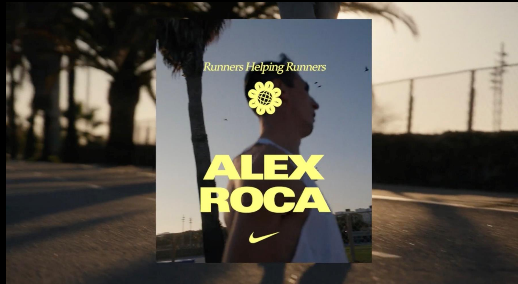
Alex Roca image corporativa de Nike en una campanya mundial