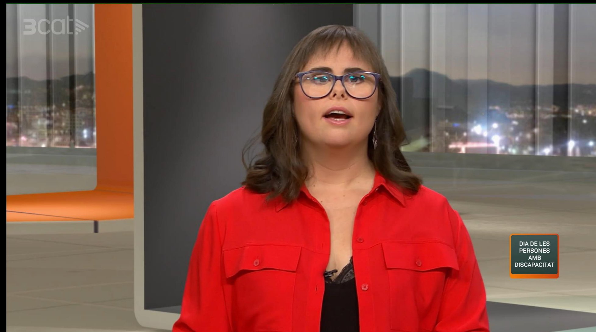
Bea Ruiz , Co-presentadora telenotícies 3cat "especial dia 3 de desembre"